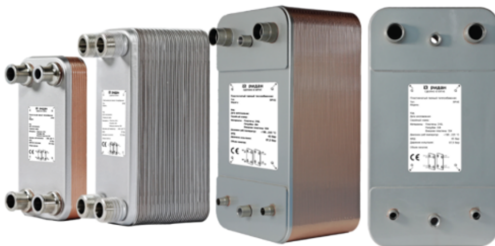
Рис.1 - Внешний вид теплообменников пластинчатых типа ВРНЕ

Теплообменники пластинчатые типа ВРНЕ предназначены для передачи тепловой энергии от одного теплоносителя к другому. Теплообменники пластинчатые типа ВРНЕ могут применяться в холодильных установках (компрессорных, абсорбционных), а также в тепловых насосах. В качестве рабочих сред могут использоваться негорючие хладагенты (фторуглеродороды, хлорфторуглеродороды, аммиак, CO 2 ), технические и холодильные масла, вода для технических нужд и систем ГВС, спиртосодержащие растворы.