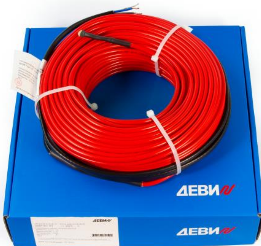
Рис. 1. Внешний вид нагревательного кабеля ДЕВИ Flex-10Т.