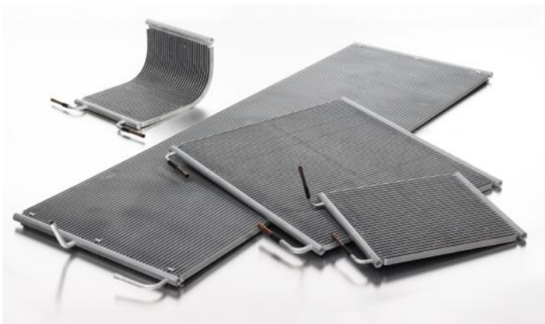
Внешний вид теплообменников микроканальных типа МСНЕ

Теплообменники микроканальные типа МСНЕ предназначены для передачи тепловой энергии от одного теплоносителя к другому в системах холодоснабжения и кондиционирования воздуха. Теплообменники МСНЕ могут использоваться в качестве конденсаторов для бытовых и коммерческих систем кондиционирования воздуха, а также в холодильном оборудовании для стандартных хладагентов (фторуглероды, хлорфторуглероды, гидрофторуглероды, такие как R410A, R407C, R134a и т. д. - жидкости группы рабочих сред 1, 2 и газы группы рабочих сред 2, согласно ТР ТС 032/2013), в качестве конденсаторов для аммиачных систем (полностью алюминиевый дизайн, включая патрубки) и как теплообменники для систем фрикулинга, работающих с водой или теплоносителями на основе гликолей (пропиленгликоль, этиленгликоль и производные). Микроканальная технология также может быть использована для испарителей, радиаторов и реверсивных систем, если такое применение предусмотрено назначением каждого конкретного теплообменника.