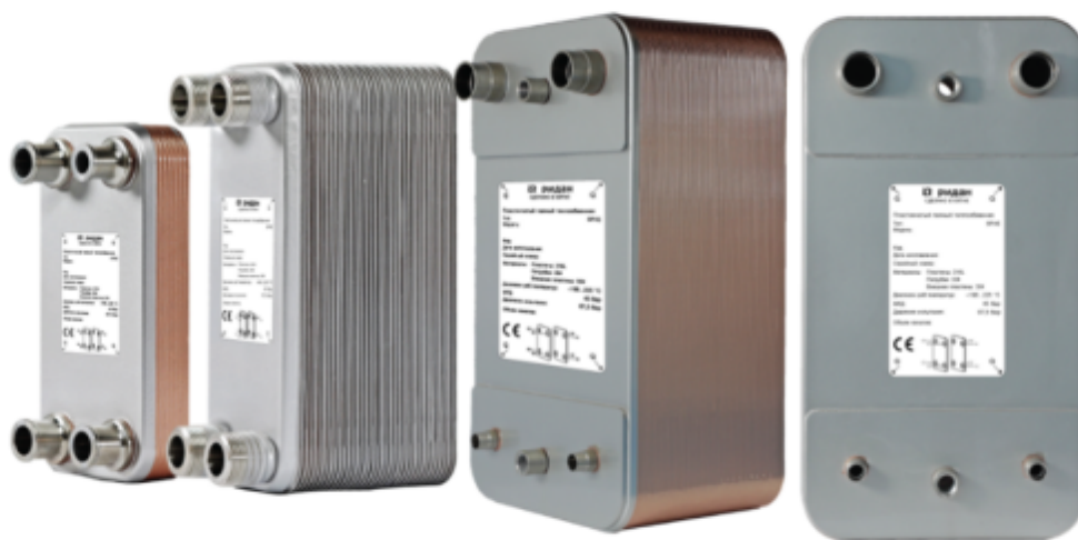
Рис.1 - Внешний вид теплообменников пластинчатых типа ВРНЕ

Теплообменники пластинчатые типа ВРНЕ предназначены для передачи тепловой энергии от одного теплоносителя к другому. Теплообменники пластинчатые типа ВРНЕ могут применяться в холодильных установках (компрессорных, абсорбционных), а также в тепловых насосах. В качестве рабочих сред могут использоваться негорючие хладагенты (фторуглероды, хлорфторуглероды, аммиак, CO 2 ), технические и холодильные масла, вода для технических нужд и систем ГВС, спиртосодержащие растворы.