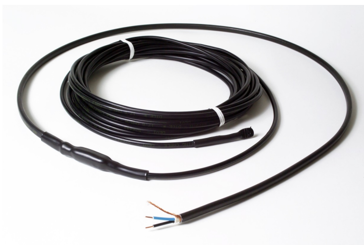
Рис. 1. Нагревательная секция кабеля ДЕВИ Snow-30T.

Нагревательный кабель ДЕВИ Snow-30T (далее – кабель) (Рис. 1) применяется для наружной установки и используется в основном для систем стаивания снега и льда на крышах, а также обогрева открытых площадок (Таблица 1). Может быть также использован в системах «Тёплый пол» и для подогрева травяных газонов. Поставляется в виде готовых к установке заводских нагревательных секций, с подсоединённым кабелем питания. Номенклатура нагревательных секций, предназначенных для питания от электросети переменного тока 230 В, включает 17 типоразмеров длины, от 10 м до 140 м.